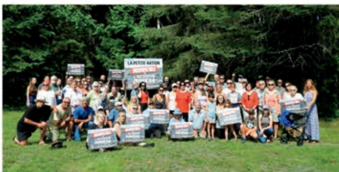
En haut: Collectif des Pas du Lieu; En bas: Rassemblement à Lac-des-Plages