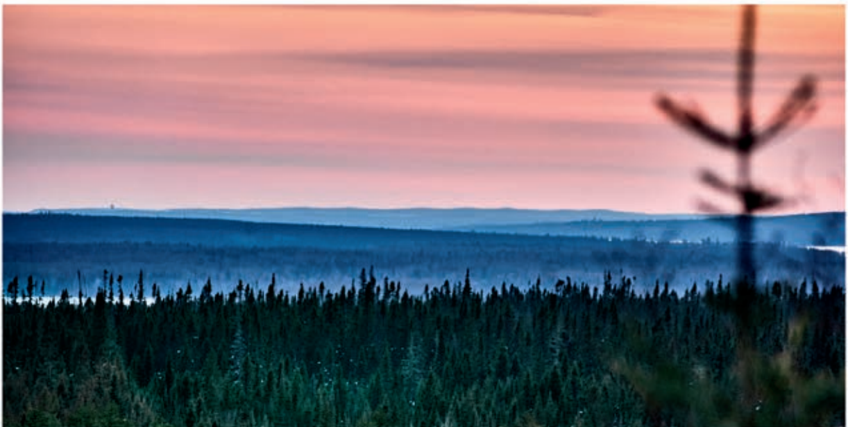
Photo: Coucher de soleil sur le versant Sud de l'esker Saint-Mathieu-Berry, sous l'emprise de claims ©Jeremy Stall-Paquet

Pour leur part, les représentantEs des 55 communautés autochtones issues des 11 Nations autochtones n'ont eu droit qu'à une demie journée de consultation sur la plateforme Zoom le 14 avril 2023.